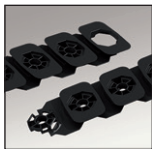
Gabarit de pose