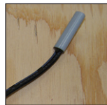
Sonde de sol de 10' (3 m)